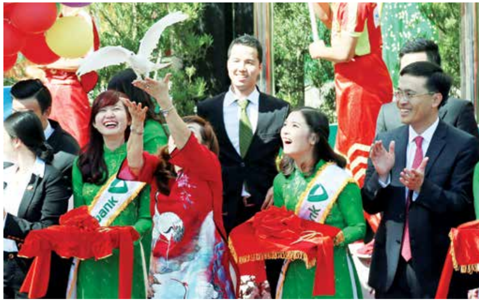
Nghi thức thả chim bồ câu hoà bình

lãnh đạo là chủ tịch HĐQT, Tổng giám đốc đại diện cho các Tập đoàn, Tổng Cty, doanh nghiệp, cùng các khách hàng cá nhân đến dự và chúc mừng.