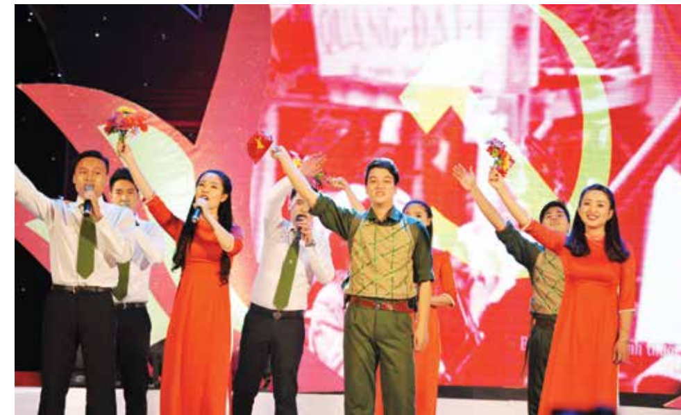
Đoàn Vietcombank với tiết mục "Tiến về Hà Nội"

cụ thể hóa Chỉ thị 42 của Ban Bí thư Trung ương Đảng về tăng cường sự lãnh đạo của Đảng đối với công tác giáo dục lý tưởng cách mạng, đạo đức, lối sống cho thế hệ trẻ, giai đoạn 2015 - 2030. Nhóm tuyên truyền ca khúc cách mạng của Đoàn thanh niên Vietcombank từng đạt giải Nhất tại Liên hoan do Đoàn Khối Doanh