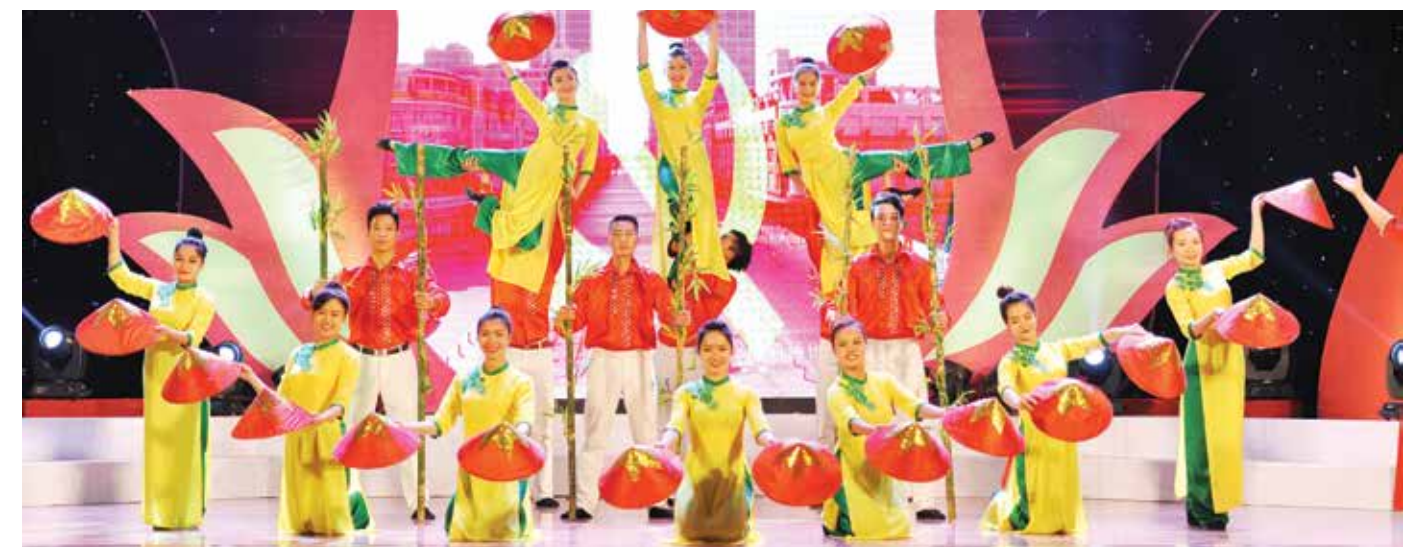
Đoàn thanh niên Vietcombank với tiết mục "Rạng rỡ Việt Nam"

Kết thúc Liên hoan, Nhóm tuyên truyền ca khúc cách mạng của Đoàn KDNTW mà Vietcombank là đại diện đã đạt giải Ba cùng Thành đoàn Hải Phòng và Tỉnh đoàn Lào Cai. Giải Nhất liên hoan được trao cho Thành đoàn TP. Hồ Chí Minh và 02 giải Nhì được trao cho Thành đoàn Hà Nội, Tỉnh đoàn Đắk Lắk. Ngoài ra, Ban Tổ chức cũng trao 05 năm giải Khuyến khích và 10 giải phụ cho các đơn vị tham gia Liên hoan. □