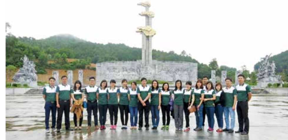
Khu di tích Trường Bản