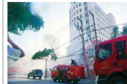
Toàn cảnh buổi diễn tập chữa cháy, cứu nạn cứu hộ

Tình huống giả định là một đám cháy xuất hiện tại sảnh giao dịch tầng 2 tòa nhà Trụ sở Vietcombank Đà Nẵng do sự cố từ thiết bị điện. Khi chuông báo cháy reo, lực lượng PCCC tại chỗ đã phát hiện kịp thời và