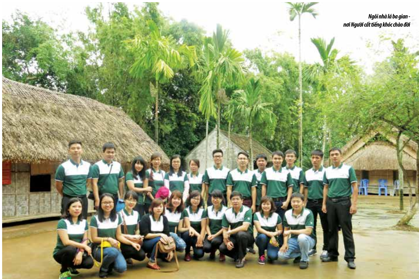
Ngôi nhà lá ba gian - nơi Người cất tiếng khóc chào đời

Làng Sen - quê nội của Bác cách đó khoảng 2km. Đây là nơi đã in dấu những ngày tháng tuổi thơ của Bác. Ngôi nhà lá 5 gian được bà con trong làng cất lên vào năm 1901. Đây là minh chứng cho tình cảm của những người dân quê đối với cụ phó bảng Nguyễn Sinh Sắc. Lúc này, mẹ Bác đã