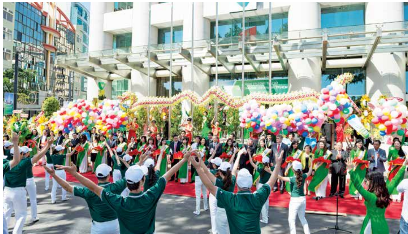
Toàn cảnh lễ khai trương trụ sở mới Vietcombank TP.HCM

Buổi lễ kết thúc với nghi thức thả chim bồ câu như một thông điệp về hy vọng hoà bình, phát triển và bền vững mà Vietcombank TP HCM nói riêng cũng như toàn hệ thống Vietcombank luôn nỗ lực hết mình để hướng đến. □