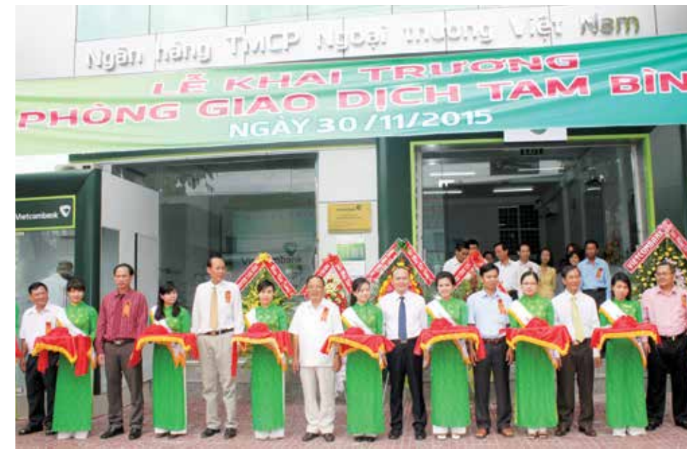
Lãnh đạo địa phương và lãnh đạo Vietcombank Vĩnh Long cắt băng khai trương Phòng giao dịch Tam Bình

» HUỲNH NGỌC TRÚC NHI - Vietcombank Vĩnh Long