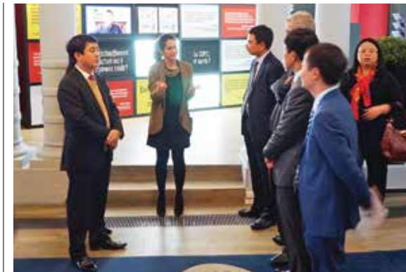
Đoàn Vietcombank nghe đại diện BNP Paribas giới thiệu về mô hình concept store

Qua trao đổi, hai bên đã thống nhất khẳng định tiềm năng phát triển to lớn của lĩnh vực ngân hàng bán lẻ và dịch vụ bảo hiểm tại Việt Nam, khẳng định những nỗ lực bước đầu của VCLI trong tiếp cận thị trường. Phát biểu tại cuộc họp, Chủ tịch Vietcombank bày tỏ quyết tâm của Ban lãnh đạo Vietcombank trong việc hỗ trợ, tạo điều kiện phát triển hoạt động của VCLI thông qua việc đẩy mạnh công tác bán chéo sản phẩm, đưa ra chính sách bảo hiểm bắt buộc đối với một số sản phẩm tín dụng... Đồng thời cũng đề xuất đối tác BNP Paribas và Cardif tăng cường hỗ trợ công ty về sản phẩm, công nghệ và đào tạo. Chủ tịch cũng định hướng VCLI cần xem xét xác định lại phân khúc thị trường, cải tiến sản phẩm, đẩy mạnh công tác thúc bán qua ngân hàng và các kênh khác nhằm nỗ lực tăng thị phần trong thời gian tới.