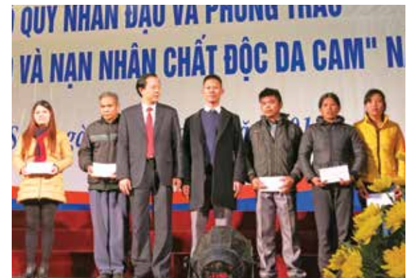
Chủ tịch Công đoàn Vietcombank Lạng Sơn tặng quà Tết cho các hộ nghèo, nạn nhân chất độc màu da cam