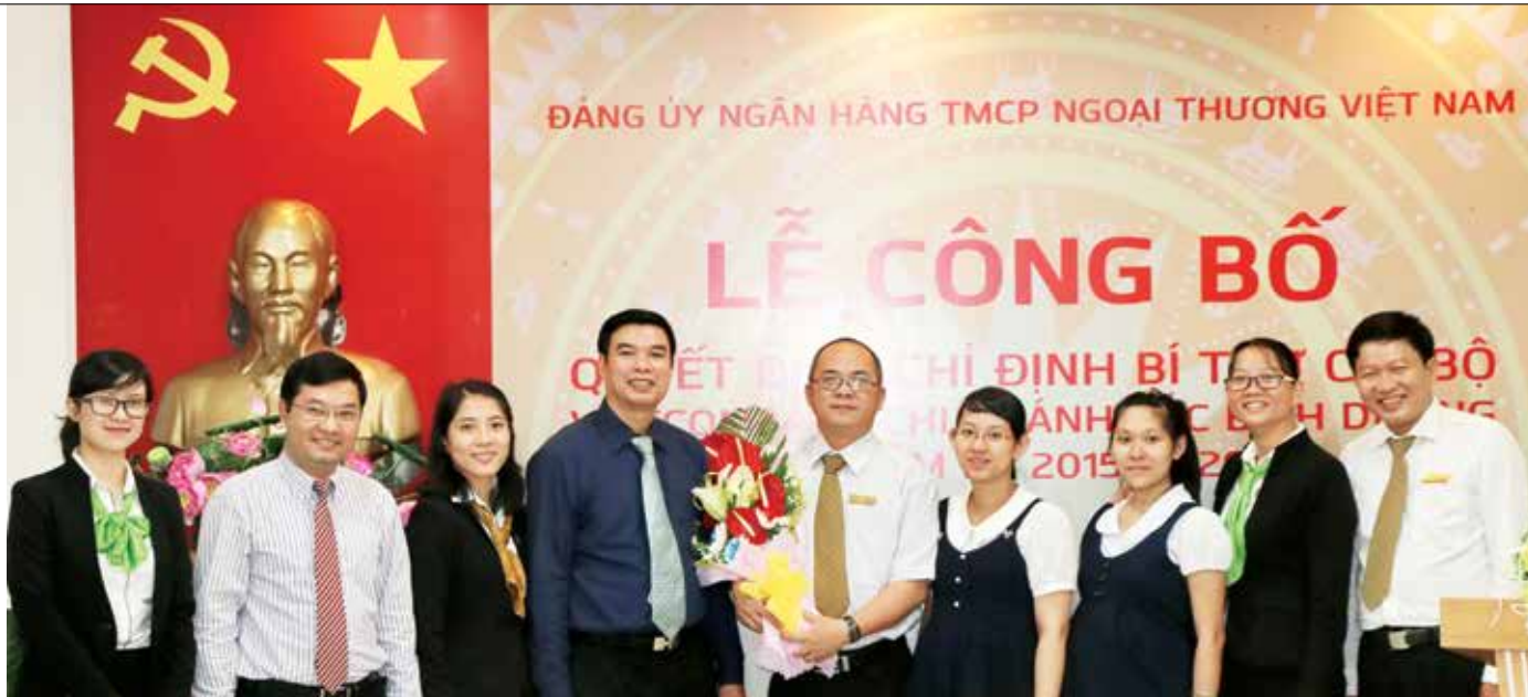
Toàn thể đảng viên của Chi bộ Vietcombank Bắc Bình Dương chụp hình lưu niệm cùng với tân Bí thư Chi bộ