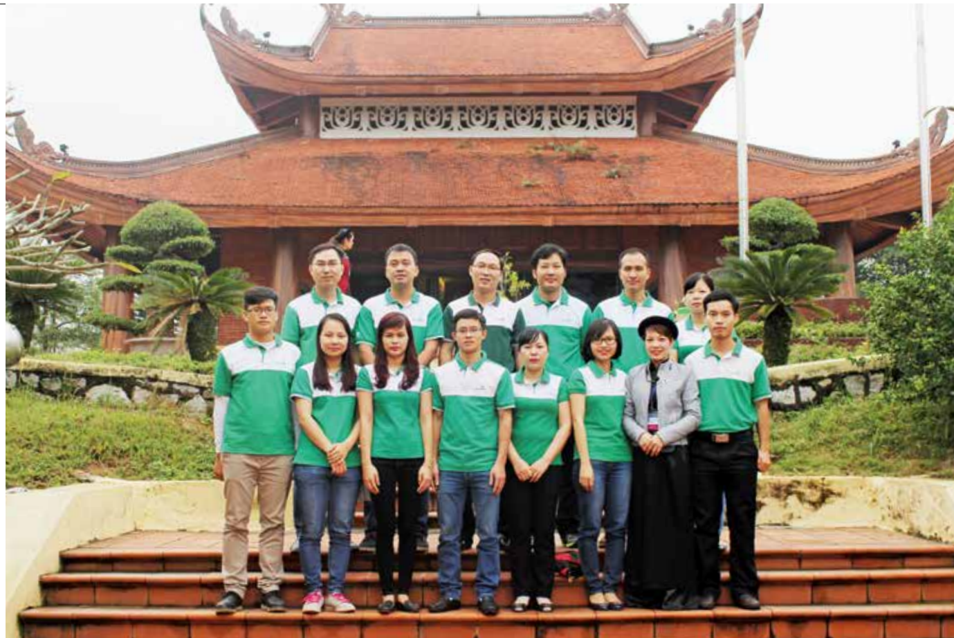
Chi bộ Vietcombank Hà Nam chụp hình lưu niệm tại nhà tưởng niệm Chủ tịch Hồ Chí Minh tại ATK Định Hóa - Thái Nguyên