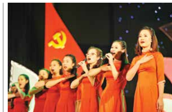
Những giai điệu tự hào" gồm các ca khúc "Quốc tế ca", "Lá cờ Đảng", "Qua miền Tây Bắc", "Giải phóng Điện Biên", "Tiến về Hà Nội", "Cúc

ngiệp Trung ương tổ chức trong tháng 9/2015 và vinh dự được lựa chọn là đơn vị đại diện cho Đoàn Khối doanh nghiệp Trung ương (KDNTW) tiếp tục tranh tài cùng các Tỉnh, Thành Đoàn trong cả nước tại Liên hoan tuyên truyền ca khúc cách mạng toàn quốc. Với lực lượng nòng cốt là các đoàn viên thanh niên đến từ Đoàn cơ sở Trụ sở chính, Sở Giao dịch, Vietcombank Ba Đình, Vietcombank Hoàn Kiếm, Vietcombank Hà Nội, Vietcombank Hải Dương, nhóm tuyên truyền đã thể hiện xuất sắc chương trình nghệ thuật mang tên "Việt Nam -