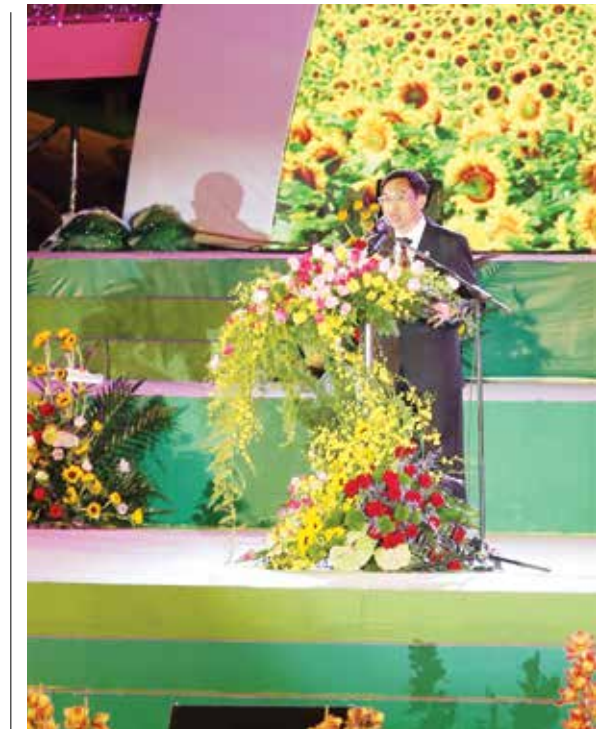
Ông Đoàn Văn Việt - Phó Bí thư Tỉnh ủy, Chủ tịch UBND tỉnh Lâm Đồng, Trưởng ban Chỉ đạo Festival hoa Đà Lạt lần thứ VI năm 2015 phát biểu Khai mạc

Sự đồng hành của Vietcombank cùng Festival hoa Đà Lạt lần thứ VI năm 2015 với vai trò là nhà quảng cáo vàng tương đương mức hỗ trợ 500 triệu đồng, ghi nhận lần thứ 2 liên tiếp Vietcombank đóng góp cho sự thành công của sự kiện tại Thủ phủ hoa của Việt Nam. Qua đó, góp phần thúc đẩy sự phát triển kinh tế xã hội của địa phương; đồng thời chung tay bảo tồn, phát huy các giá trị văn hóa bản địa với trách nhiệm của một ngân hàng phát triển hướng đến cộng đồng. □