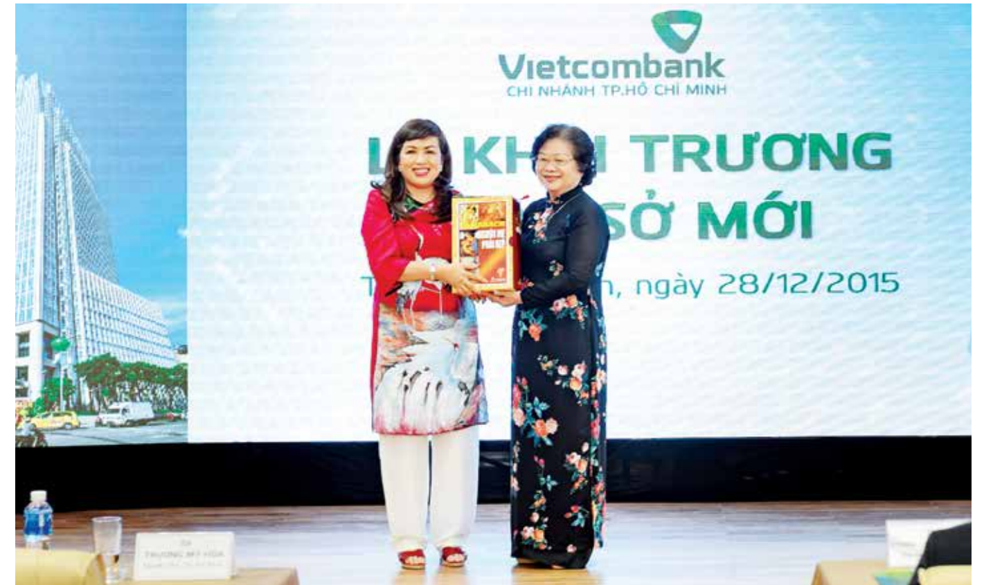
Bà Trương Mỹ Hoa – nguyên Bí thư TW Đảng, nguyên Phó chủ tịch nước CHXHCNVN (bên phải) tặng sách kỷ niệm cho Vietcombank TP. HCM

Cơ cấu quà tặng: Mỗi khách hàng đủ điều kiện sẽ được tặng 01 quà tặng Pin sạc dự phòng trị giá 300.000 VNĐ mỗi quà. Thông tin thể lệ chương trình: tại http://www.vietcombank.com.vn Thông tin sản phẩm: tại http://www.vietcombank.com.vn Mọi chi tiết xin liên hệ điểm giao dịch Vietcombank gần nhất hoặc số Hotline của VCLI 043.974.9988 và Trung tâm Dịch vụ khách hàng 24/7 của Vietcombank 1900.54.54.13 để được tư vấn, hỗ trợ.