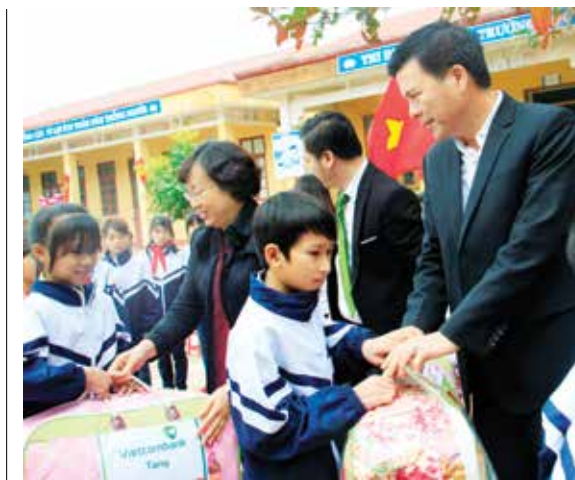
Lãnh đạo UBND tỉnh Bắc Giang và Vietcombank tặng chăn ấm cho các em học sinh

Tại trường phổ thông Dân tộc bán trú THCS Hộ Đáp (Lục Ngạn - Bắc Giang), đoàn đã thăm và trao tặng 75 chiếc chăn bông cho các em học sinh của trường. Đây là quà tặng do chính cán bộ nhân viên các phòng của Trụ sở chính Vietcombank trực tiếp quyên góp, mua và tặng các em