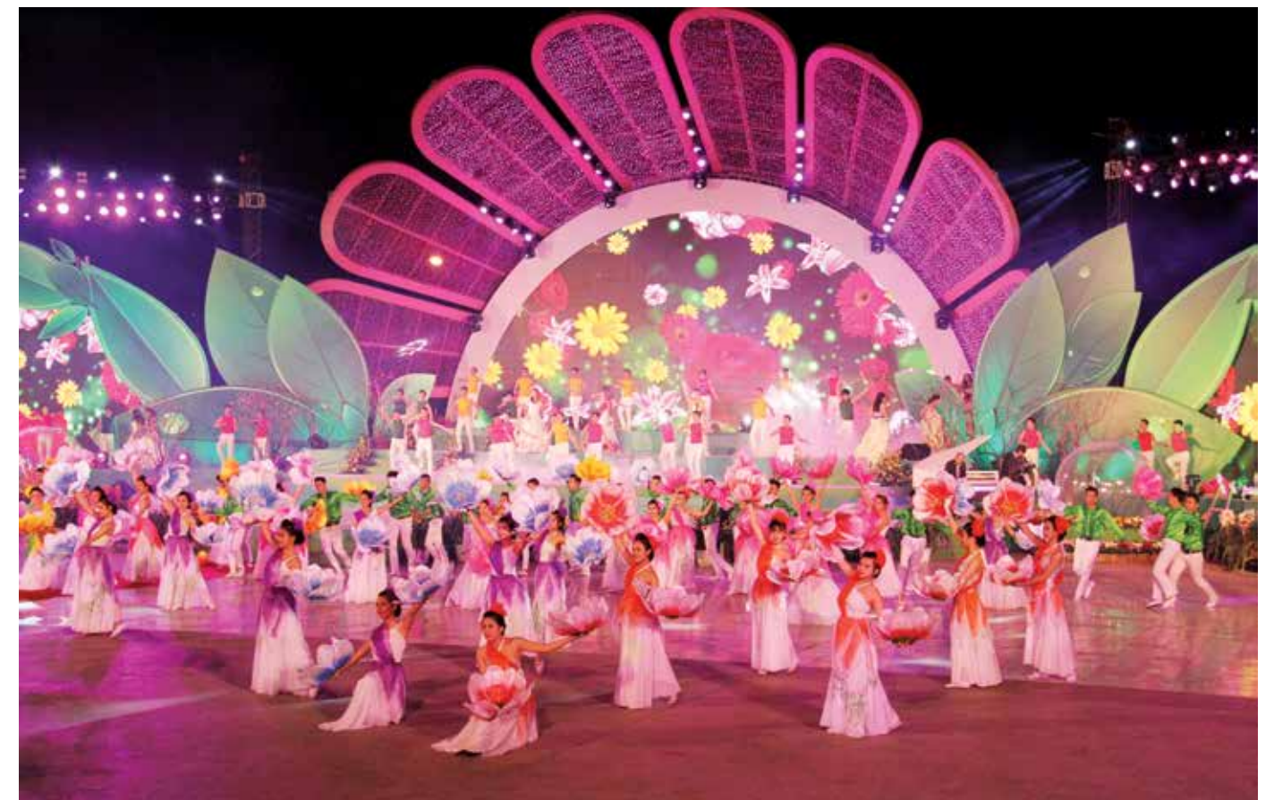
Lễ khai mạc Festival hoa Đà Lạt lần thứ VI năm 2015

Festival hoa Đà Lạt là sự kiện mang tầm quốc gia, được tổ chức lần đầu tiên vào năm 2005 và định kỳ 2 năm một lần tại thành phố ngàn hoa với nhiều chương trình đặc sắc và ấn tượng, thu hút hàng ngàn khách du lịch trong và ngoài nước đến tham quan, nghỉ dưỡng. Đây là dịp để thành phố Đà Lạt trưng bày, triển lãm các loại rau, hoa, cây cảnh của địa phương cũng như