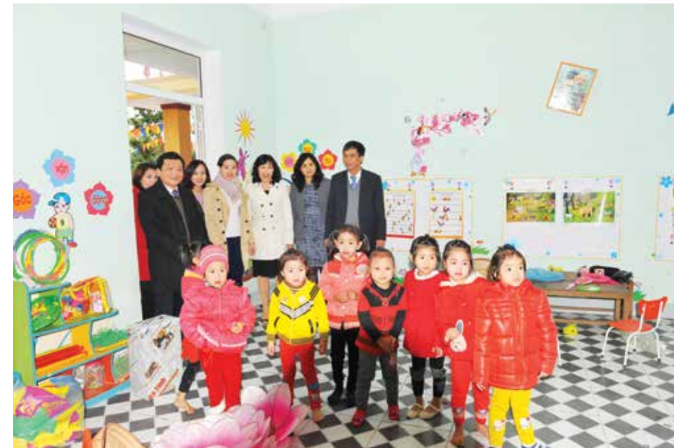
Lãnh đạo địa phương và Vietcombank thăm nơi ăn, ngủ và học tập của các cháu học sinh Trường mầm non Hương Xuân

Sau gần 10 tháng triển khai với sự quan tâm, tinh thần và trách nhiệm cao của các cơ quan, đơn vị và chính quyền địa phương, Trường mầm non Hương Xuân đã được hoàn thành đúng tiến độ, tạo điều kiện cho các giáo viên nuôi và dạy tốt các con em học sinh cả về thể chất và trí tuệ. Công trình còn được trang bị nhiều thiết bị, đồ dùng học tập cũng như vui chơi và nghỉ ngơi của các cháu như bàn ghế, giường ngủ chắc chắn sẽ góp phần giúp các cháu học sinh có thể yên tâm học tập, vui chơi, các cô giáo tự tin hơn khi được công tác trong ngôi trường khang trang này. □