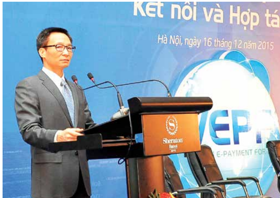
Ông Vũ Đức Đam - UVTW Đảng, Phó thủ tướng Chính phủ phát biểu tại diễn đàn

Ngày 16/12/2015 tại Hà Nội, Báo điện tử VnExpress phối hợp với Ngân hàng Nhà nước (NHNN) Việt Nam tổ chức Diễn đàn Thanh toán điện tử Việt Nam 2015 (VEPF 2015). Tham dự diễn đàn có ông Vũ Đức Đam - UVTW Đảng, Phó thủ tướng Chính phủ; ông Vũ Viết Ngoạn - Chủ tịch Ủy ban Giám sát tài chính Quốc gia; ông Nguyễn Toàn Thắng - Phó Thống đốc NHNN Việt Nam; ông Trần Tuấn Anh - Thứ trưởng Bộ Công Thương; ông Đỗ Hoàng Anh Tuấn - Thứ trưởng Bộ Tài chính; ông Vũ Tiến Lộc - Chủ tịch Phòng Thương mại và Công nghiệp Việt Nam (VCCI); đại diện cao cấp của các bộ, ngành, ngân hàng... Về phía Ngân hàng TMCP Ngoại thương