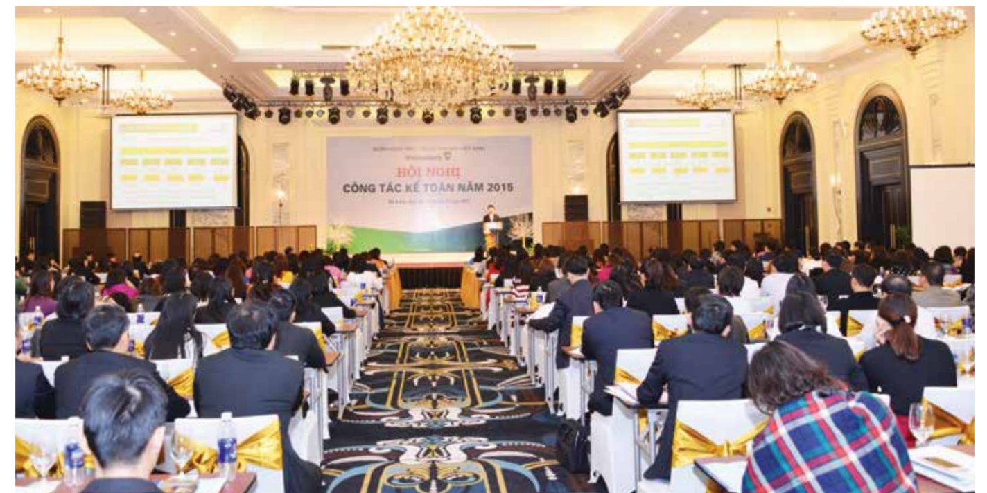
Toàn cảnh Hội nghị công tác Kế toán Vietcombank 2015

Sau 02 ngày làm việc khẩn trương và nghiêm túc, Hội nghị đã thành công tốt đẹp. □