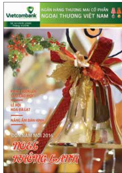
BẢN TIN CỦA NGÂN HÀNG TMCP NGOẠI THƯƠNG VIỆT NAM SỐ 12/2015 (269) Tháng 1/2016

7 - Thắt chặt mối quan hệ hợp tác và đối tác với BNP Paribas và BNP Paribas Cardif