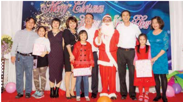
Gia đình các bé chụp ảnh cùng Ông già Noel