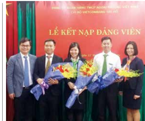
Ban giám đốc Vietcombank Tây Hồ tặng hoa chúc mừng các đảng viên mới