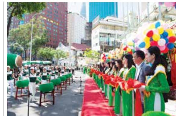
Nghi thức cắt băng khánh thành hoành tráng, đẹp mắt

Tham dự buổi lễ có bà Trương Mỹ Hoa - nguyên Bí thư TW