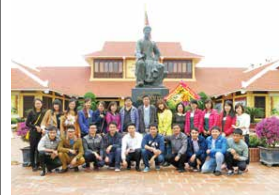
Khu lưu niệm cụ Nguyễn Du