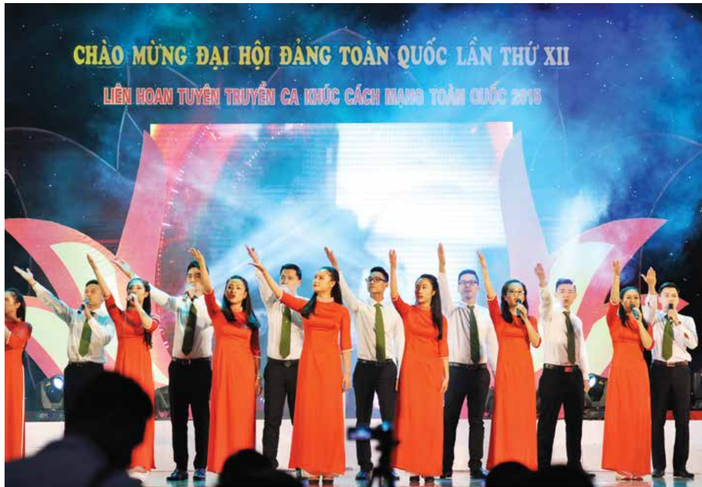
Đoàn Vietcombank với tiết mục "Lá cờ Đảng"